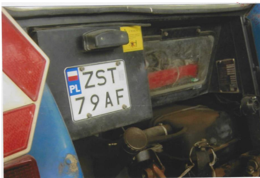
Zbliżenie tablicy rejestracyjnej ciągnika rolniczego marki Pronar MTZ 82A