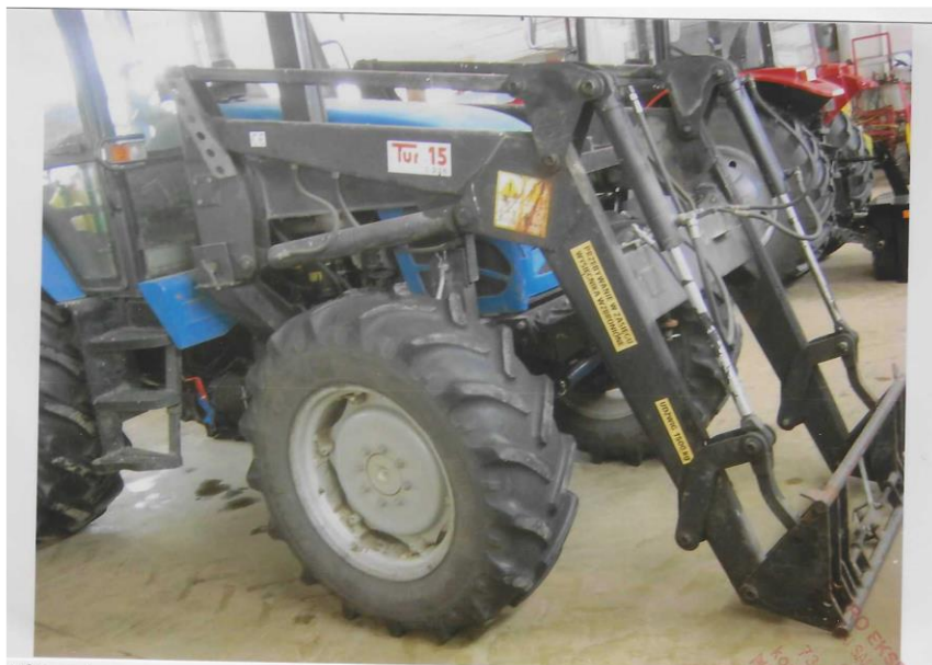
Widok ogólny ciągnika rolniczego marki Pronar MTZ 82A o nr rej. ZST 79AF z ładowaczem czołowym marki TUR15 – przednia prawa strona