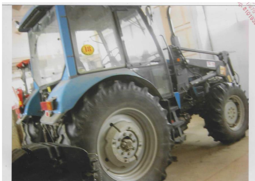
Widok ogólny ciągnika rolniczego marki Pronar MTZ 82A z ładowaczem marki TUR15 nr rej. ZST 79AF