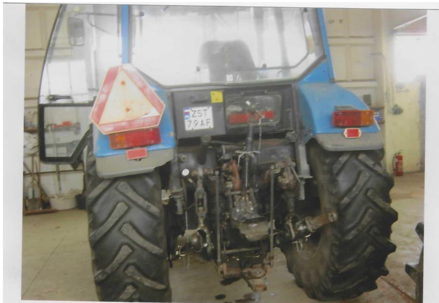
Ciągnik rolniczy marki Pronar MTZ 82A o nr. Rej. ZST 79AF tylna strona