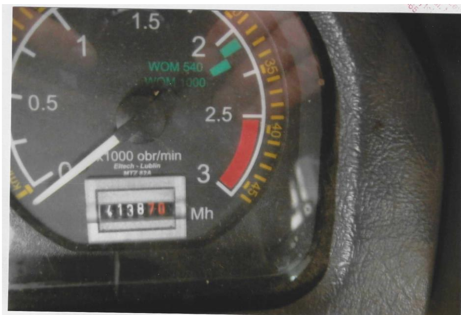
Wskazania licznika motogodzin w kabinie ciągnika rolniczego marki Pronar MTZ 82A o nr rej. ZST 79AF