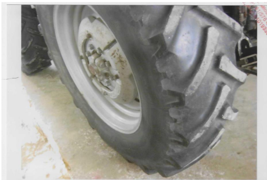
Widok koła tylnego z ogumieniem w ciągniku rolniczym marki Pronar MTZ 82A