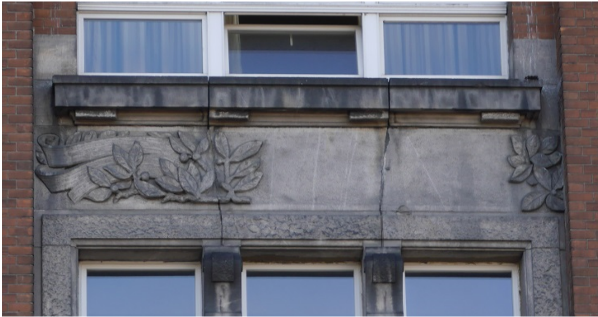
DETAL - I (do odtworzenia na wzór poz. 12)