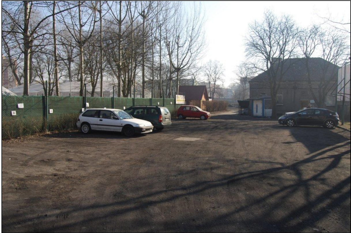
Dz. nr 90/7, obręb 1022, Śródmieście 22, gmina Miasto Szczecin