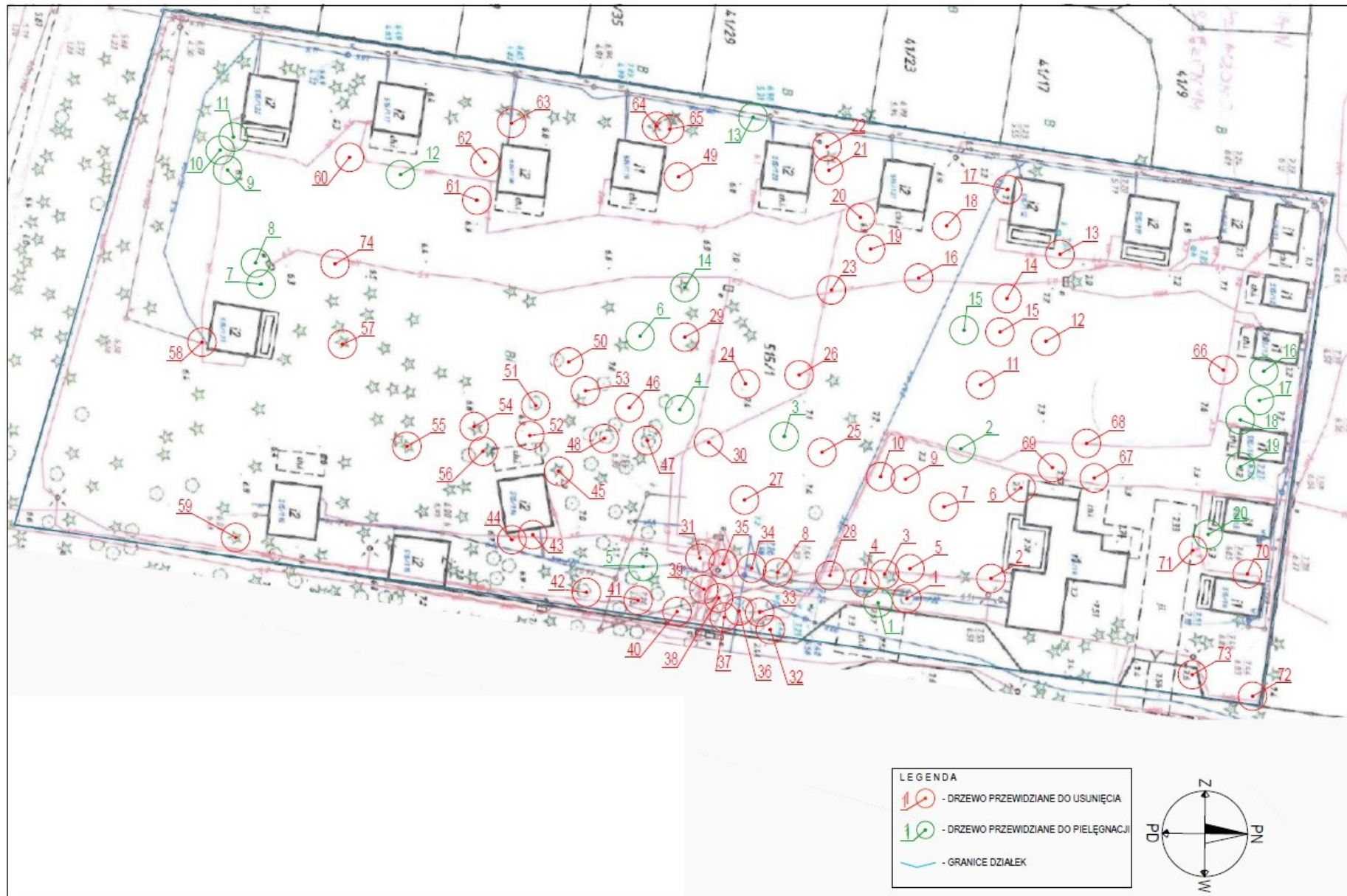
Mapa przedstawiająca drzewa do wycinki i do pielęgnacji na terenie Ośrodka Wypoczynkowego ZUT w Łukcinie ul. Uzdrawiskowa 1.