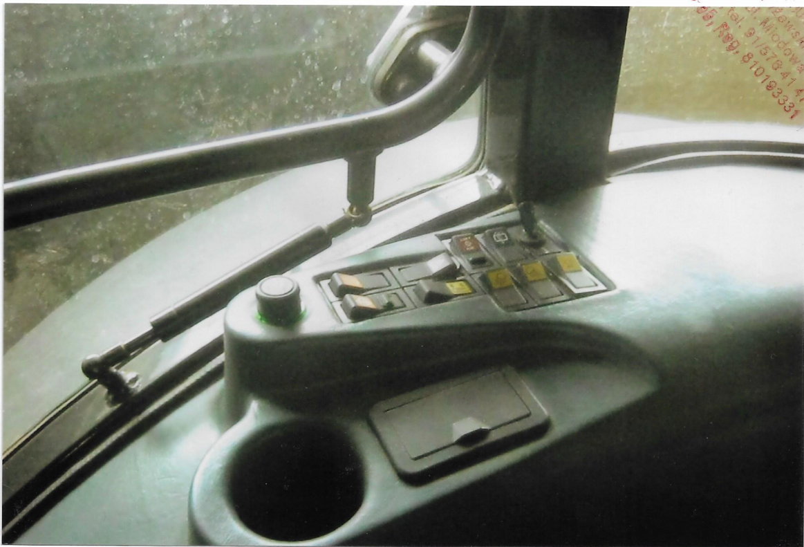
Widok panelu sterującego z funkcjami poszczególnych mechanizmów i urządzeń w ciągu roku rolcierym nr. rej. Ursus 10014R - ZST 1451

SPERTYZ SPECJALIZACJA ING. inż. Janusz ul. 110 Grzędzina 13-101-1018 (Reg. 810784147) ul. 601, 13-101-1018 NIP 884-107-60-05, Reg. 810193331